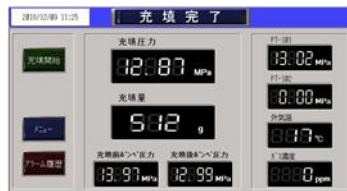
5. 充填結果を画面で確認します。