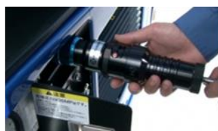
2. 充填ノズルを取り付けます。