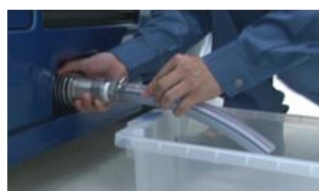
1. 生成水を排出します。