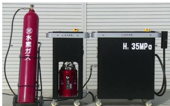
商品名：ベルステーションmini 株式会社 鈴木商館殿との共同開発品となります。