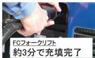
4. 充填ノズルを取り外します。