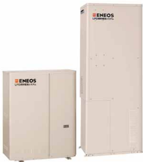
燃料電池 発電ユニット 貯湯ユニット