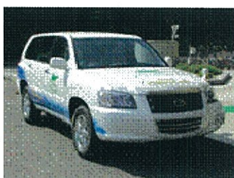
(車両提供：北九州市)