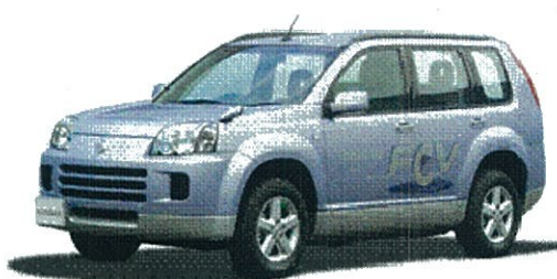
(車両提供：日産自動車(株))